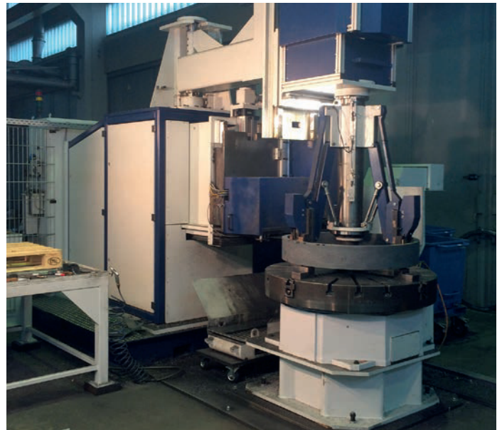
Bild 6: Prototyp GRC2000-500CNC, der am Standort für Lohntrennarbeiten eingesetzt wird