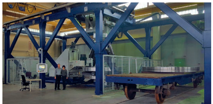
Bild 2: Giant Ring Cutter GRC5300-1000CNC in der Gesamtansicht